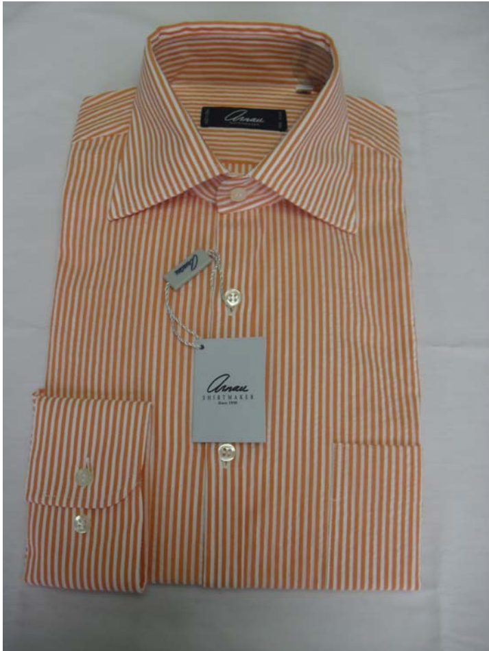
Serie 701/ 6 Modelo PETER